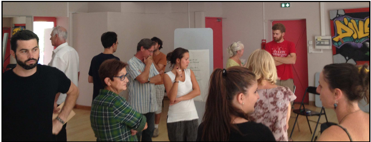
Rencontre EVS – Janvier 2015 – Montpellier

Il existe des attentes en particulier sur le besoin de faire réseau, de rompre l'isolement, d'échanger sur les pratiques professionnelles ainsi que sur un nombre assez considérable de thématiques liées à l'activité professionnelle des acteurs. Le thème de la parentalité étant identifié comme prioritaire.