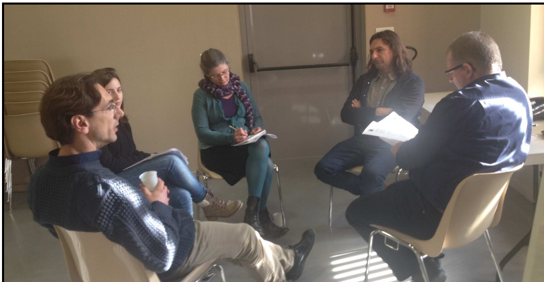
Journée Directeurs – Décembre 2015 - Narbonne

Les Délégués ont participé à deux journées de rencontre avec leurs pairs à la FCSF.