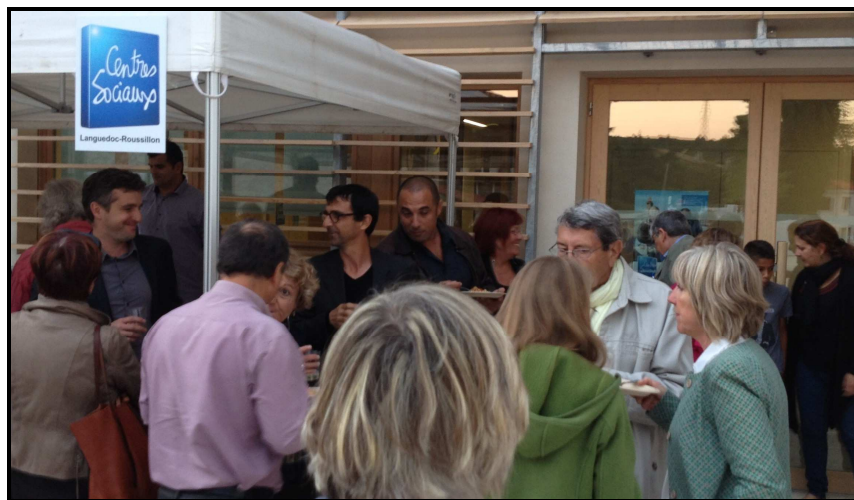
Inauguration Siège Social – Octobre 2015 - Grabels