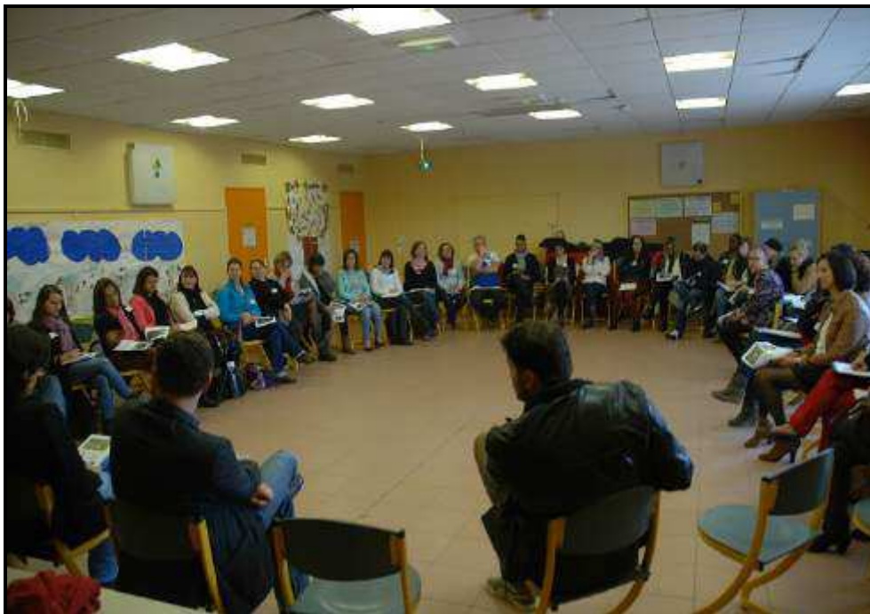
Journée Interrégions – Novembre 2015 – Rochefort du gard