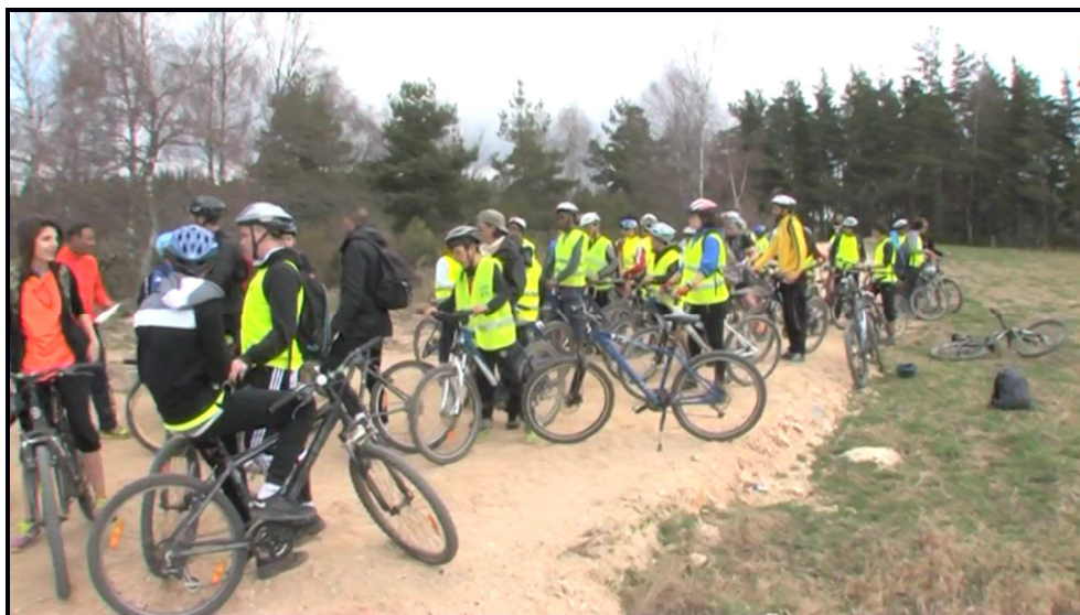
Tour à vélo – Avril 2015 – Mende

Il a donc été décidé en Conseil d'Administration Fédéral de la poursuite de cette action avec l'aide d'un Centre pour la coordination et ce à compter de 2016.